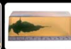
Resultado do disparo em Gelatina Balística Nua (sem anteparos).