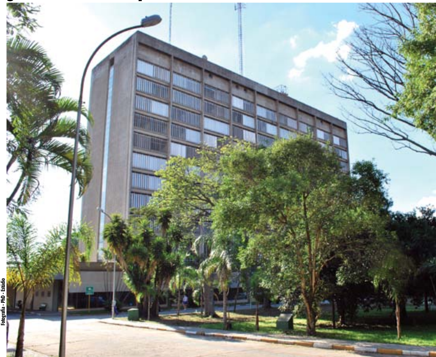
Fotografia - PhD - Estúdio

Fundado há mais de 120 anos, o Centro Médico da Polícia Militar dispõe de profissionais dedicados e estrutura adequada para garantir a saúde do profissional