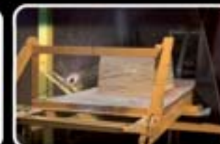
Disparo em Gelatina Balística através de parabrisa de automóvel (Vidro Laminado).