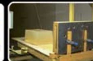
Disparo em Gelatina Balística através de duas Chapas de aço automotivo.