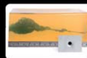
Resultado do disparo em Gelatina Balística através de duas Chapas de aço automotivo.

Munições Série Tactical Copper Bullet e Gold Hex APROVADAS PELO PROTOCOLO TÉCNICO POLICIAL