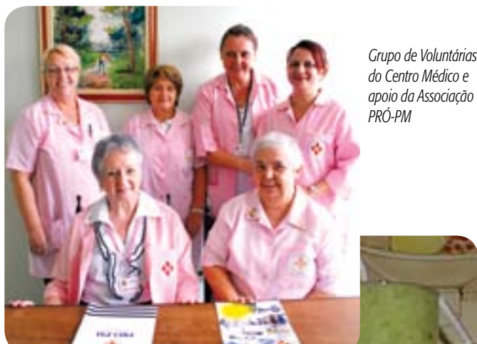
Grupo de Voluntárias do Centro Médico e apoio da Associação PRÓ-PM

Durante a temporada de calor, o consumo de sucos aumenta. Não há nada mais refrescante e nutritivo do que incluir a bebida no café da manhã ou nos lanches entre as refeições. A novidade é que eles estão sendo enriquecidos com substâncias que dão energia, força muscular, emagrecem e até ajudam no combate à celulite. A linhaça é rica em ômega 3, um antioxidante e antiinflamatório, que ajuda a regular o intestino. Enquanto o gérmen de trigo, além de auxiliar no trato intestinal e ser rico em vitamina E, tem outra propriedade: aumenta os níveis de serotonina, substância do cérebro que dá sensação de bem-estar e facilita o sono. A maçã, o abacaxi e o gengibre ajudam a combater a celulite porque desintoxicam e fazem uma limpeza na rede linfática. O abacaxi e o gengibre são antiinflamatórios naturais. Colaboram na destruição dos nódulos de gordura, acumulados sob a pele. Sem contar que o gengibre também tem funções diuréticas. Já as fibras da maçã melhoram o funcionamento do intestino. Incluindo esses ingredientes e acrescentando o gérmen de trigo e a linhaça no cardápio diário, você estimula a diminuição da celulite.