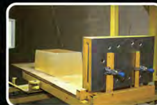
Disparo em Gelatina Balística através de duas Chapas de aço automotivo.

Com o compromisso em atender com eficácia as missões de operação das Polícias, oferecendo aos policiais brasileiros o que há de melhor em termos de munição, a CBC desenvolveu o Protocolo Técnico Policial, inspirado no consagrado Protocolo do FBI, adequado à realidade de nosso país.