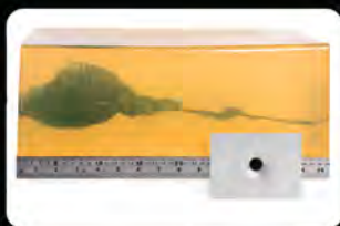
Resultado do disparo em Gelatina Balística através de duas Chapas de aço automotivo.