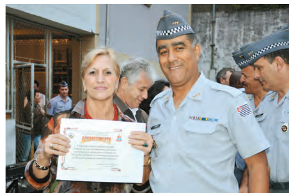
Recebemos homenagem do Comando do Policiamento da Capital