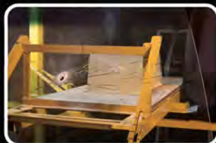
Disparo em Gelatina Balística através de parabrisa de automóvel (Vidro Laminado).