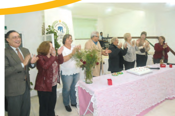
Festa de aniversariantes (acima) e Festa do Dia das Mães (acima e ao lado): alegria geral