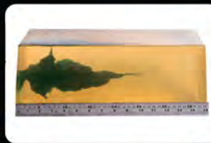
Resultado do disparo em Gelatina Balística Nua (sem anteparos).